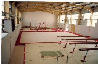
mögliche Nutzung (Beispiel Bastia/Korsika)

den. In den nächsten Monaten steht ein langfristiger Vertrag mit ewb an. Gleichzeitig mit der Vertragsunterzeichnung war auch schon der eilends bestellte, neue Gymnova-Boden (Wert 42'000 Fr.) zur Stelle, um endlich, endlich, im Kanton über einen permanenten 12 x 12m Trainingsboden zu